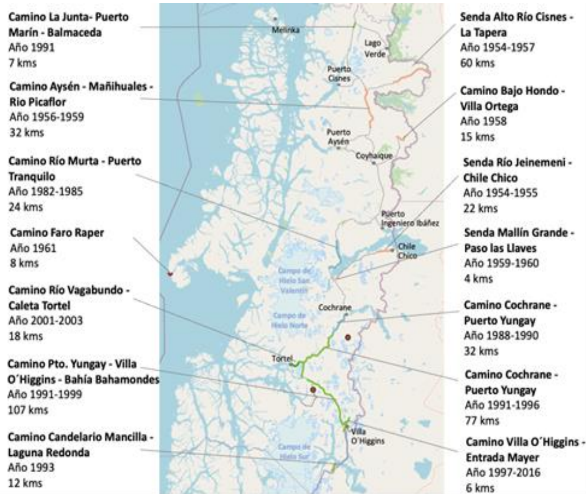
Figura 1. Obras ejecutadas por el Cuerpo Militar del Trabajo en la región de Aysén